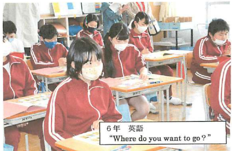
6年 英語 “Where do you want to go?”

「難しい内容の授業でしたが、楽しく勉強できていたので良かったです。振り返りの部分で、人の良いところを認めて、それを口に出すことができるのがとてもいいなあと思いました。あらためて素敵な友だちなあと思いました。(6年保護者)」