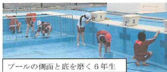
プールの側面と底を磨く6年生