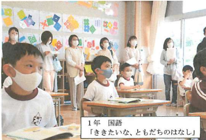
1年 国語 「ききたいな、ともだちのはなし」

いただいた感想の一部を紹介します。「小学生になり、教室で勉強している姿を見ることができました。先生の言っていることを理解しているようで安心しました。周りの友だちとも仲良くしている姿、手を挙げている姿、いろいろな姿を見ることができた参観日でした。コロナ対策を考えて開催してくださりありがとうございます。