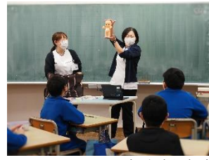
県立大船渡病院（助産師） 様