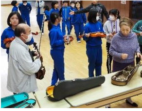
リアスオーケストラ 様