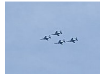
(ベニランド上空にブルーインパルス飛行)