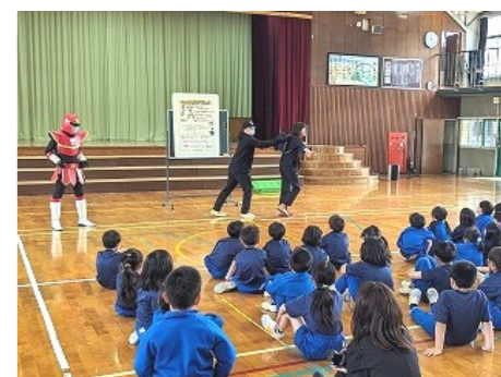
身を守る方法について