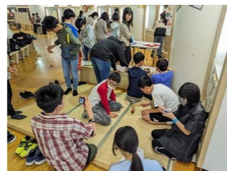
東北歴史博物館 体験活動