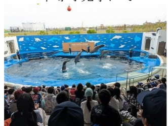
仙台うみの杜水族館1カショー