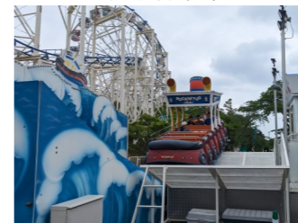
八木山ベニランド