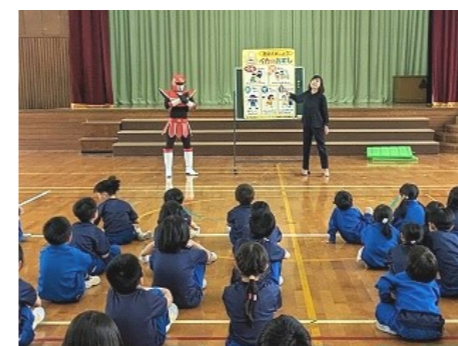
「いかのおすし」についての説明 不審な人に声をかけられたとき(寸劇)

【いかのおすし】 ☆知らない人についていかない ☆知らない人の車にのらない ☆おおきな声でさけぶ ☆すぐにげる ☆家の人や先生にしらせる