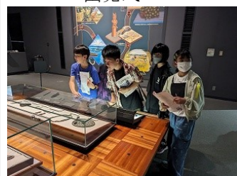
東北歴史博物館 展示見学