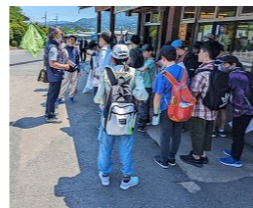
ガイドさんにお礼のあいさつ(中尊寺見学にて)

楽しく学びの多い修学旅行でしたが、ほんの少しの失敗があったり、我慢したり、思い通りにいかなかったことがあったりしたものと思います。しかしながら、そうした負の部分も、これからにつながる貴重な経験となり、また一つステップアップした6年生です。保護者の皆様には、お見送りやお迎え等、様々ご支援・ご協力ありがとうございました。